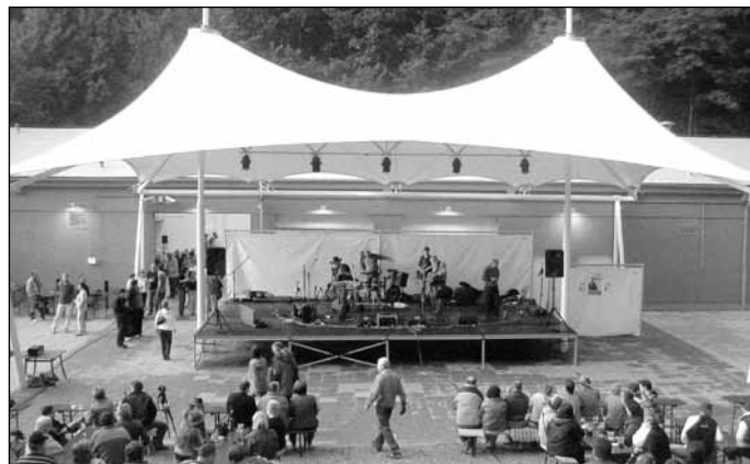
Návštěvníci slavnostního křtu využili nového zastřešení pódia i jako své útočiště před deštěm