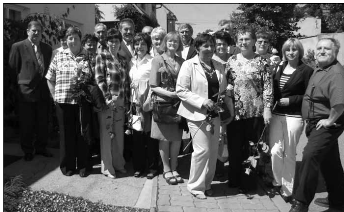
V sobotu 13. 6. 2009 bylo na OÚ slavnostně přijato 19 místních občanů a rodáků obce Popovice, kteří v letošním roce dosáhnou krásného jubilea 60ti let