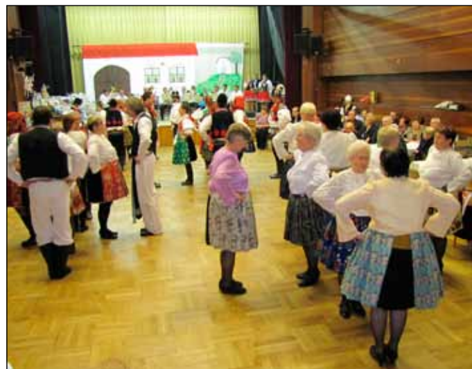
4. 2. I druhý ročník krojového plesu zaplnil sál množstvím krojů z různých regionů. Moravskou besedu tančilo 20 párů téměř všech věkových kategorií.