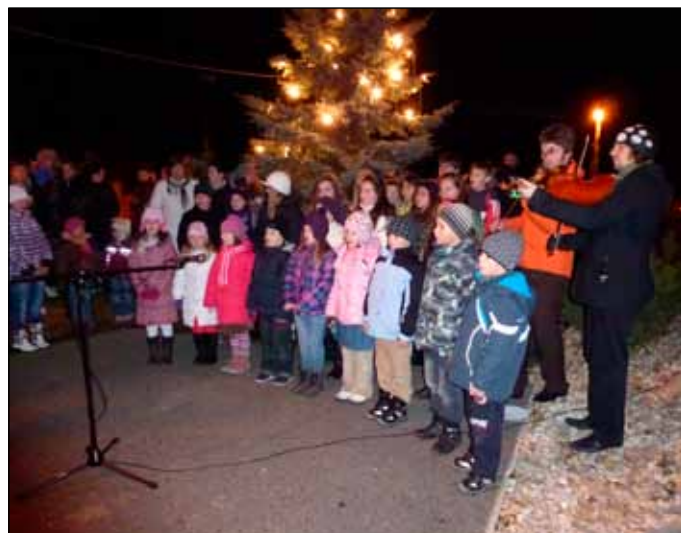
18. 12. U vánočního stromu se sešla opět spousta lidí.