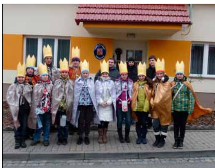
7. 1. Tříkráloví koledníci byli většinou děti z Popovjánku.