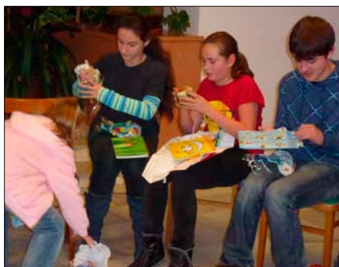
28. 12. Besídkou a nadílkou v přísálí KD ukončil rok 2011 soubor Popovjánek.