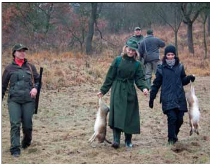
10. 12. Na tradičním Babském honu skutečně ženy nechyběly.