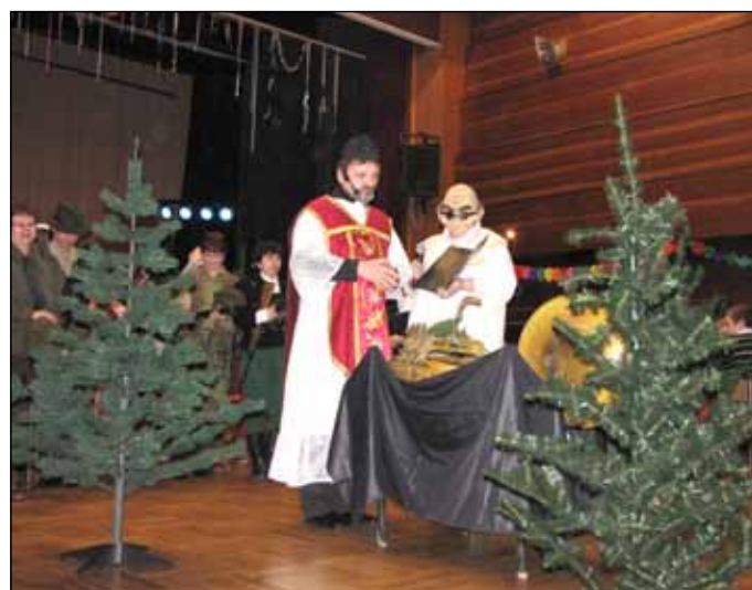
18. 2. Maškarní ples je velmi oblíbenou akcí. Ani jeho dvanáctý ročník nezklamal.