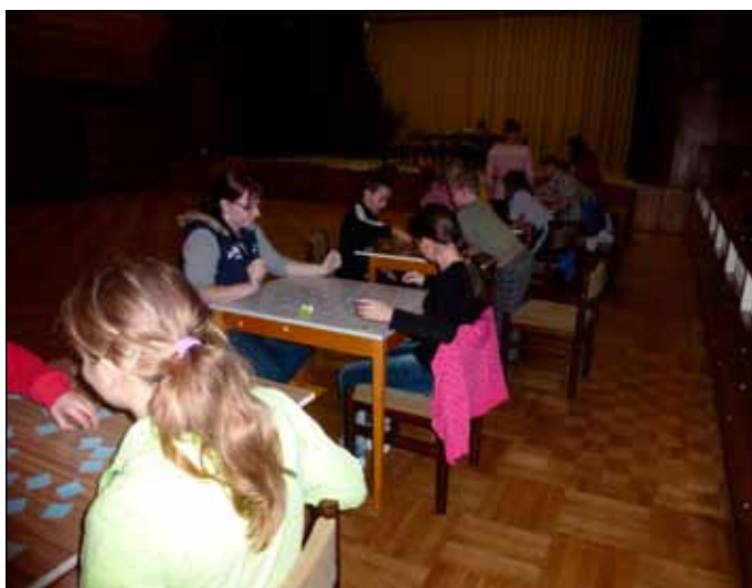
16. - 17. 12. Turnaj v pexesu vyžaduje maximální soustředění. O turnaj a zejména o nocování na kulturáku je stále velký zájem.