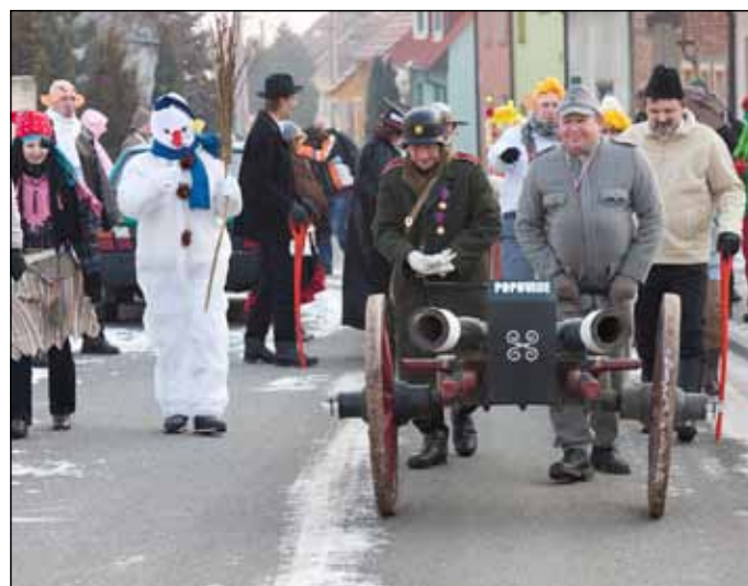
11. 2. Fašanková obchůzka sice díky mrazu bez muziky, ale opět vydařená. Masek bylo méně, na táhnutí děla zbyl pouze Švejk a generál.