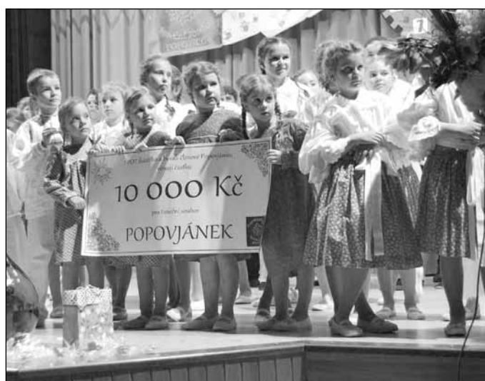
Časostroj, sestrojený právě pro tuto příležitost, ukazoval, jak čas rychle letí ať už dopředu či pozpátku a jak rychle se z dospělých zase stanou děti.