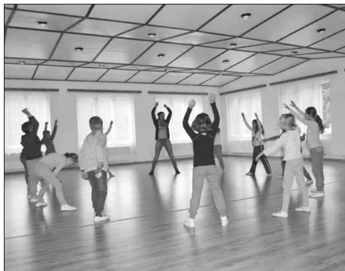
I přes nepříznivé počasí si děti pobyt na Smradávce užívaly. Když jsme oznámili, že s ohledem na jejich zdraví, ukončíme pobyt dřív, bylo z toho velké pozdvižení.