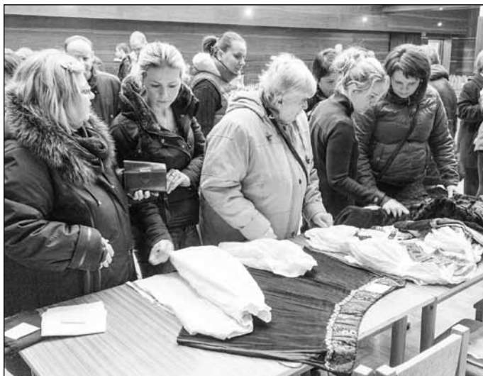
SPOT Slunéčko uspořádalo 15. března v Popovicích burzu krojů. Setkala se hned napoprvé s velkým zájmem.