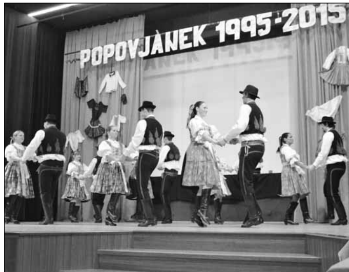
6. března se v kulturním domě sešla víc než stovka současných i bývalých členů Popovjánku a představil se nový soubor Popovjan.