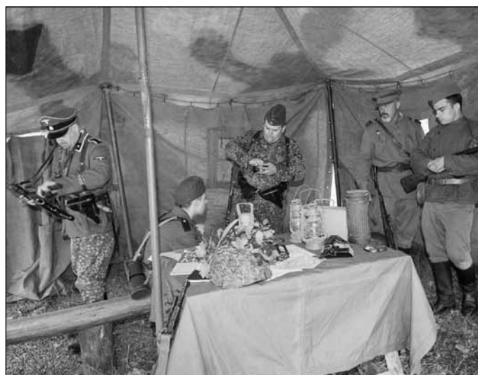
Pro malé i ty odrostlejší kluky byla na výstavě velkým lákadlem vojenská technika.