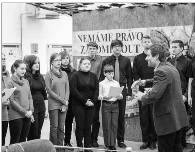
Oslavy 70. výročí osvobození – důstojná, slavnostní, dojemná i poutavá výstava.