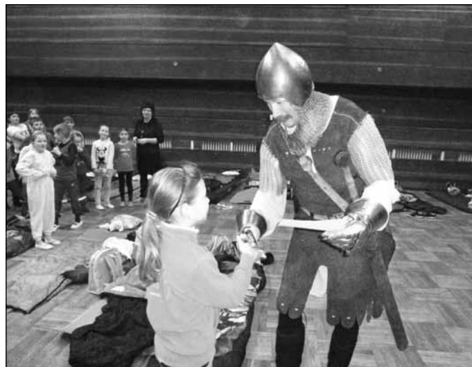
Účastníky Noci s Andersenem pořádané 27. 3. místní knihovnou poctil svou návštěvou opravdový rytíř!