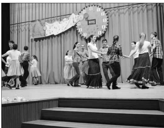
Vystoupení Popovjánku, bývalých členů, Popovjanu i Hopsáku provedlo diváky uplynulými léty činnosti souboru.