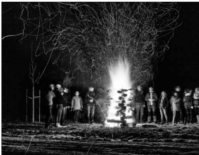
Na Miloníně 21. 3. vzplála velká vatra, to se Spotáci poprvé zapojili do Keltského telegrafu. Ohně se rozsvěcovaly postupně na kopcích napříč celého Česka. Byl to nádherný zážitek.