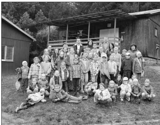
Členové Popovjánku se 1. a 2. května na své výroční vystoupení ke Dni matek a narozeninám souboru připravovali na RS Dopravák na Smradávce.