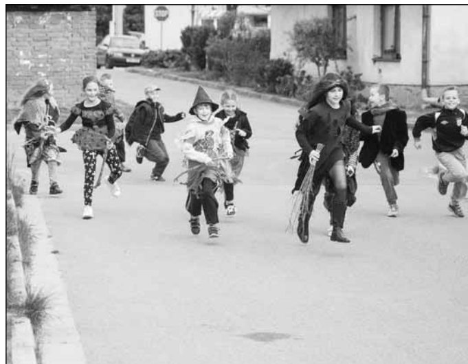
Slet čarodějnic se i v naší obci stal vítanou akcí malých i těch starších čarodějek a čarodějnic. Pod taktovkou Klubu žen uskutečnily 30. dubna rozjařený průlet obcí.