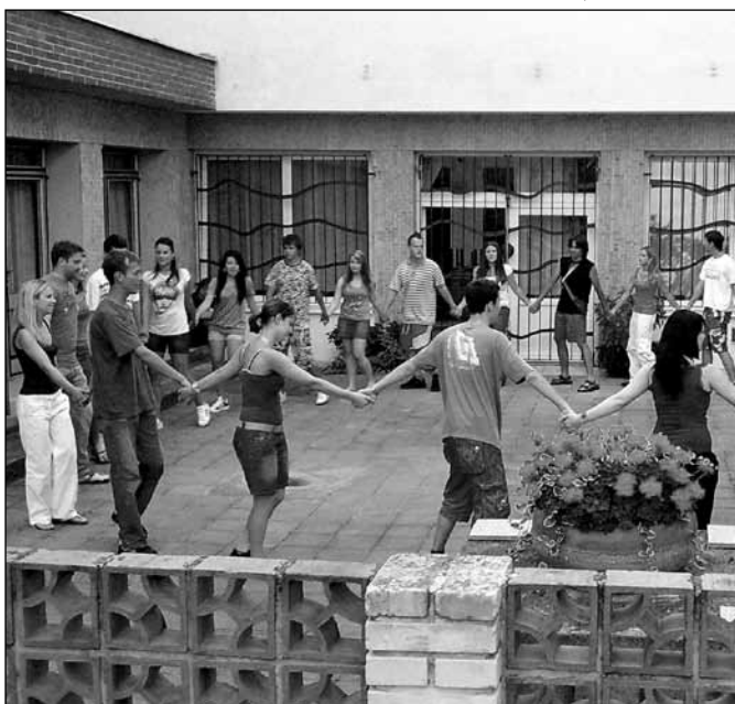
Od srpna probíhá v kulturním domě i mimo něj intenzivní nácvik hodového pásma. Letošních hodů se zúčastní dvacet párů a samozřejmě děti z Popovjánku.