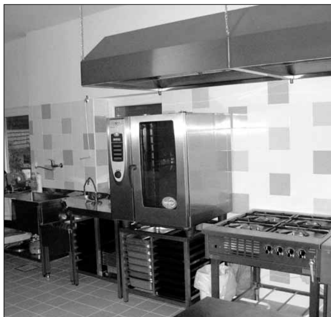
Ve čtvrtek 10. září se uskutečnil Den otevřených dveří, kdy se mohli zájemci přijít podívat na novou podobu zrekonstruované kuchyně mateřské školy a jejích skladových prostor.