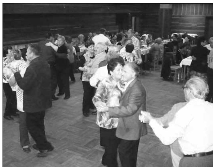
... a po vydatném a chutném jídle bylo dobré přijaté kalorie vytančit při hudební produkci Boršické čtyřky.