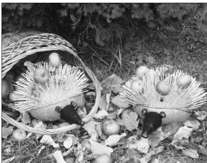
Bohužel úroda dýní byla letos špatná, i tak vystavené umělecké výtvořiny potěšily oko poroty i kolemjdoucích.