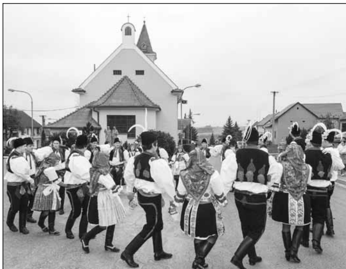
Seřadiště chasy bylo už 3. rokem u kostela, snad se po úpravě prostranství u horního kříže vrátí na tradiční místo.