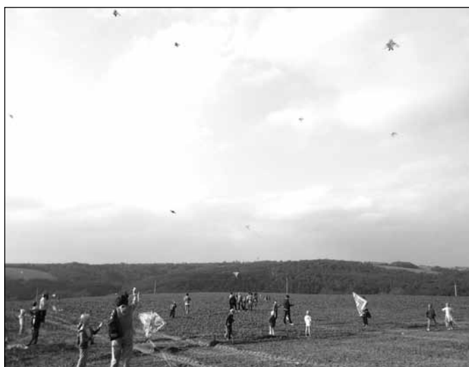
Účast na podzimní drakiádě byla letos rekordní