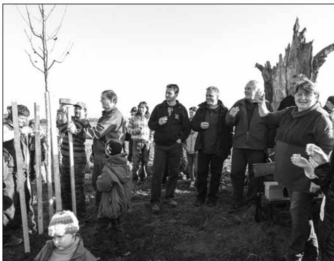
Při výsadbě hrušky se sešlo tolik nadšenců, že by mohla být vysazena i celá alej...