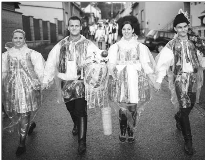
Hody v Popovicích se letos neobešly bez pláštěnek, ale naštěstí šlo o krátkodobé přeháňky...