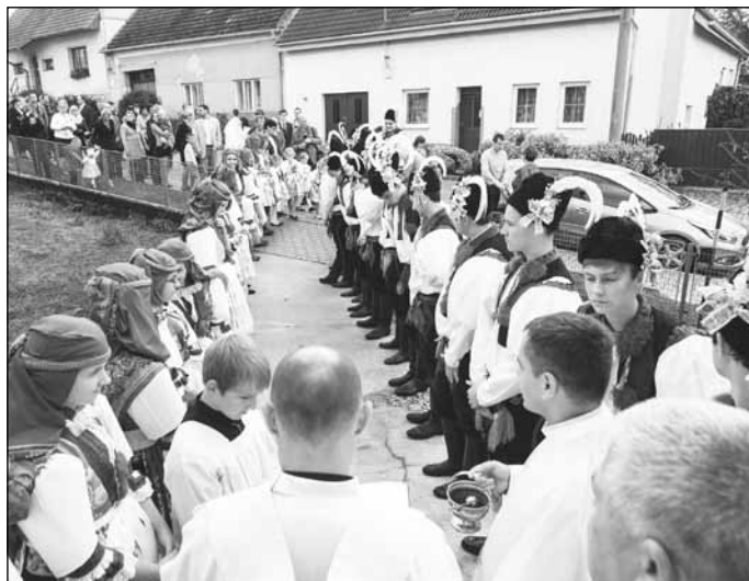
Přítomnost krojované chasy jistě přispěla ke slavnostnímu rázu vysvěcení zrekonstruované fary.