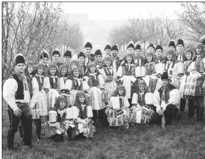
...tak si chasa mohla hodové veselí náležitě užít a pan fotograf vše náležitě zdokumentovat.