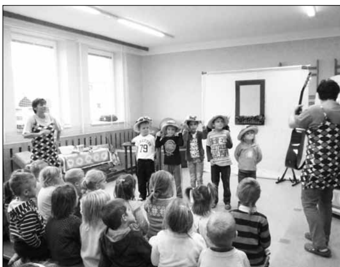
„Brněnské tetiny“ děti z MŠ skvěle pobavily a také je do svého vystoupení aktivně zapojily.