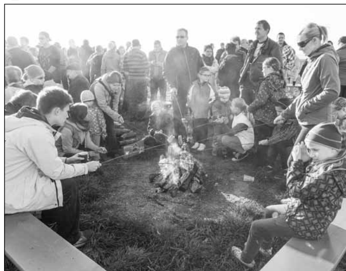
... po dobře odvedené práci a na čerstvém vzduchu všem pěkně vyhládlo, příště musíme nakoupit více špekáčků.