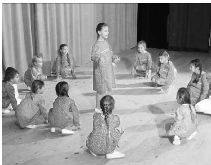
Pro důchodce na jejich setkání byl tradičně připraven kulturní program v podobě vystoupení Popovjánku a herců Slováckého divadla...