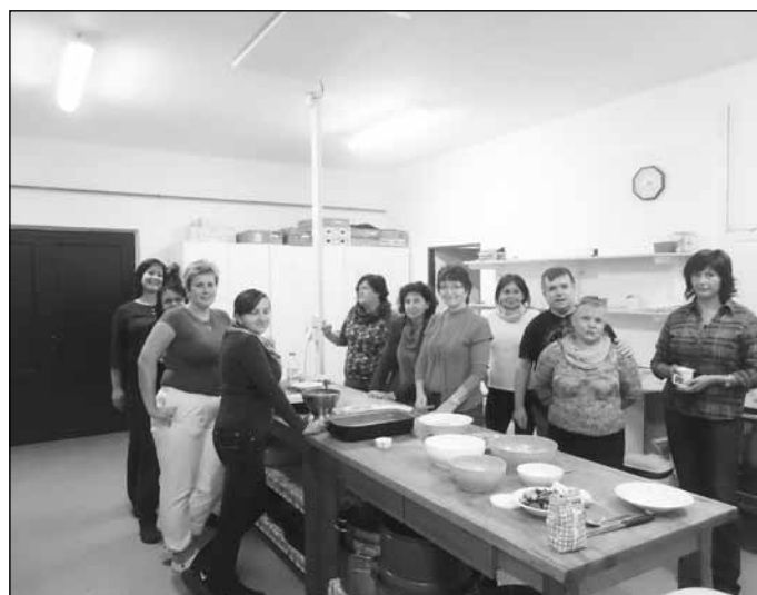
Jídla podle receptů našich babiček účastnice vaření nadchla, přišla vhod i příchozím návštěvníkům z výsadbě hrušky.