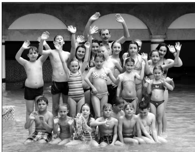
27. - 28. 4. Popovjánek se zúčastnil taneční soutěže v Českém Dubu. Odměnou za skvělé výkony byla návštěva aquaparku.