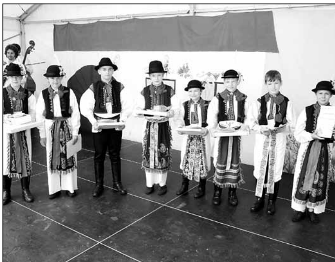
18. 5. Na Jarmarku řemesel se opět utkali mladí verbíři a předvedli to nejlepší, co umí. Nesměly chybět zabijačkové speciality, originální lidové výrobky a temperamentní vystoupení folklorních souborů.