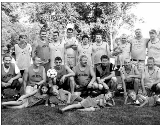
3. 8. Turnaj ve stolním tenise nadchl účastníky všech věkových kategorií