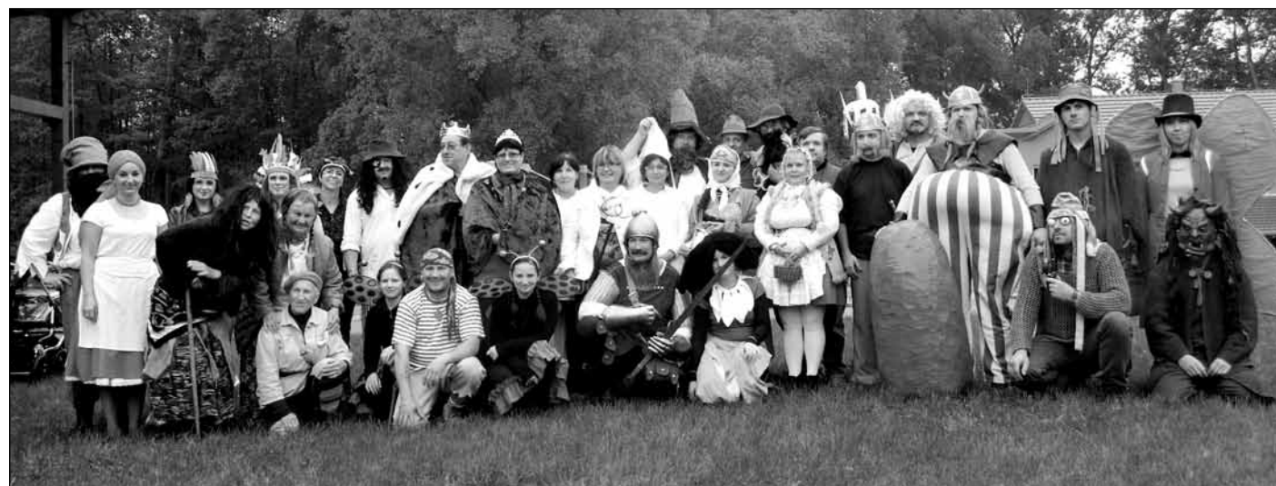
1. 6. Pohádkový les - u rybníků a na Amfíku se jako každoročně sešlo velké množství nejrůznějších pohádkových postav. Návštěvnost byla opět o něco větší i přesto, že trasu účastníci absolvovali většinou v pláštěnkách či s deštníky.