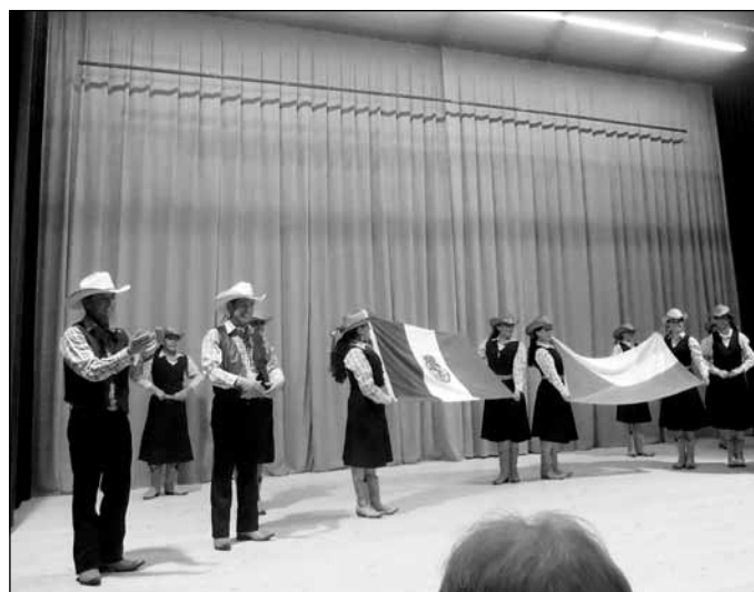
21. 8. Večer s příchutí chilli - čili vítěz Mexiko byl od začátku do konce nabitý energií a závěrečný aplaus nebral konce