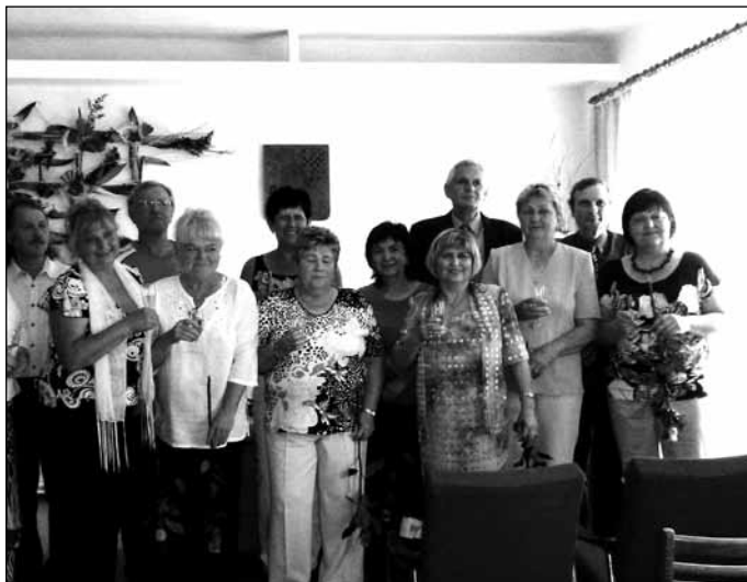
8. 6. Na obecním úřadě se uskutečnilo slavnostní přijetí letošních jubilantů - ročníku 1953