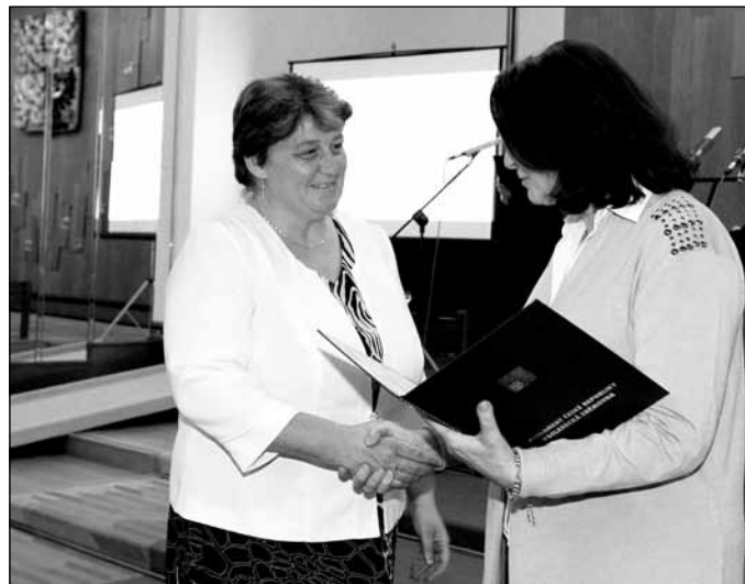
10. 6. V Poslanecké sněmovně parlamentu ČR převzala starostka obce dekret o přidělení znaku a vlajky obce