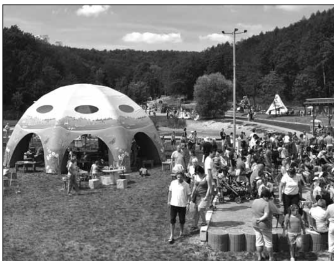
18.8. se otevřely brány Amíku davům návštěvníků, kteří se přišli podívat na Farmářské slavnosti.