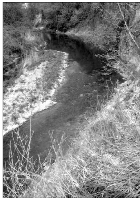
Krásná - zatím nezregulovaná - část řeky Olšavy.