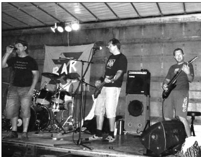
28. 7. hřiště TJ - Kapela ZZ Bar na improvizovaném podiu z návěsu nákladního auta opět pořádně rozjela skvělou zábavu.