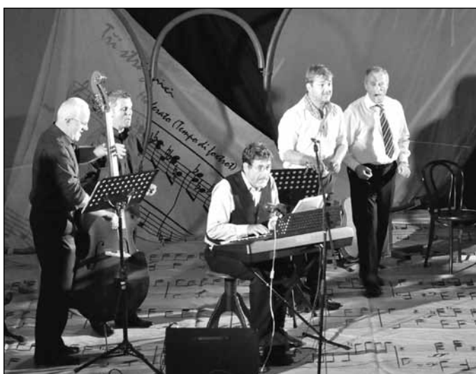
19.8. Amík - Herci Slováckého divadla předvedli návštěvníkům nádherné představení Tři strážníci plné písniček a povídaní o Jaroslavu Ježkovi.