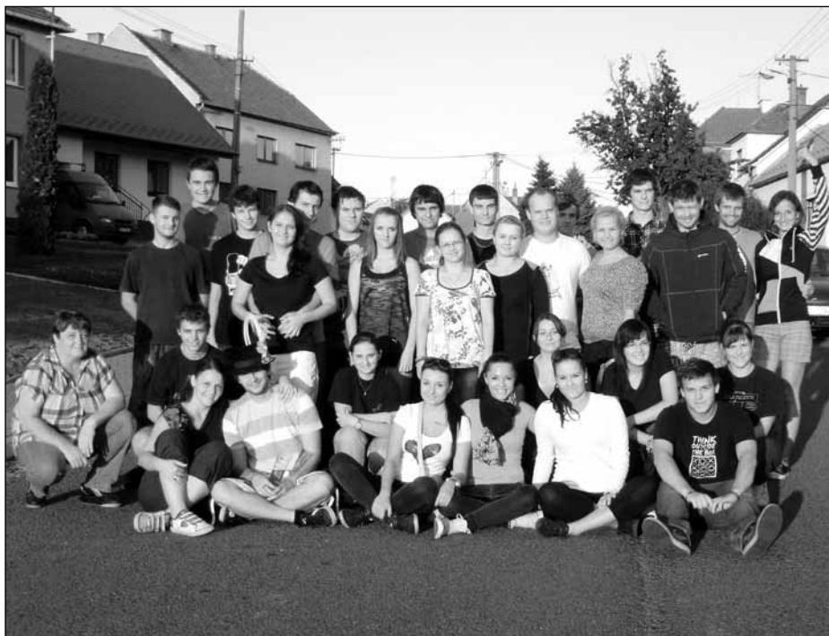
Stárci a hodová chasa Vás srdečně zvou: „Připojte se k průvodu v kroji nebo civilu, přijďte na zábavu, prostě - pojďte s námi hodovat!“