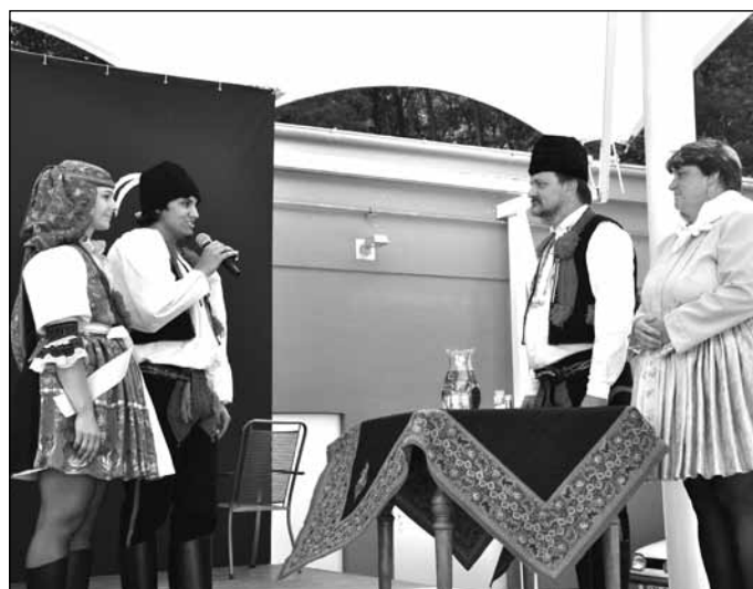
V rámci slavností uspořádalo SPOT Slunečko tradiční Dožínky, kde mimo spotáků vystoupili: soubor Botík, CM Mladý Včelaran, CM Rubáš a DH Komňané.