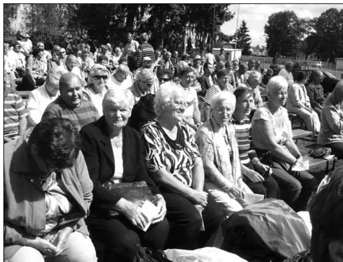
Zájezd do Dubňan na přehlídku dechových hudeb, pořádaný pro naše občany ZO ČZS Popovice, se vydařil.