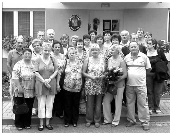
10. 8. se na obecním úřadě uskutečnilo přijetí ročníku 1952. Příjemná atmosféra a dobrá nálada se nesla celým setkáním, které pokračovalo na Amíku Bukovina.