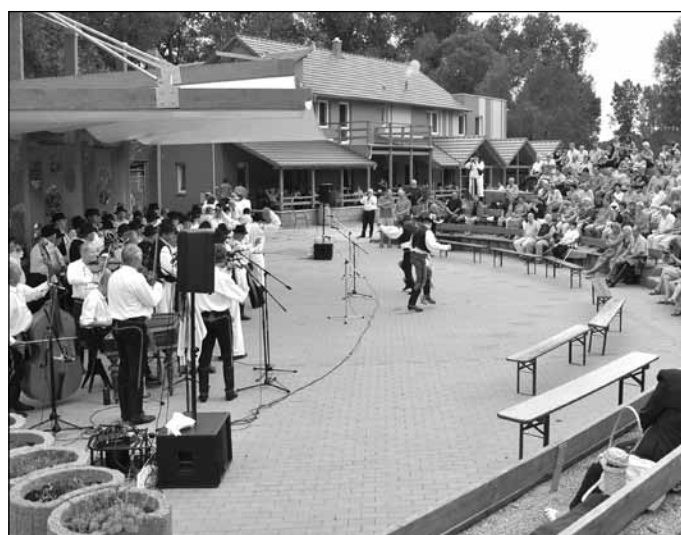
25. 8. Amík - Popovský kontráš si mezi milovníky folkloru našel své stále příznivce. Letošní ročník si částečně do své režie vzal Klub Štěpánů.