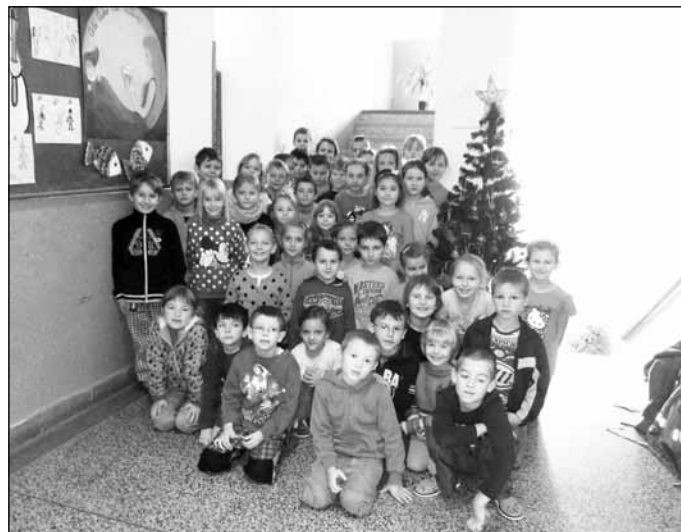
Příjemné prožití vánočních svátků a šťastný nový rok 2015 přejí děti a zaměstnanci základní a mateřské školy Popovice.