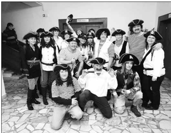
Klub žen přeje nejen svým členkám, ale také všem spoluobčanům Popovic, klidné a krásné prožití svátků vánočních. Hodně zdraví, štěstí a radostných setkání na dalších akcích připravených v roce 2015.