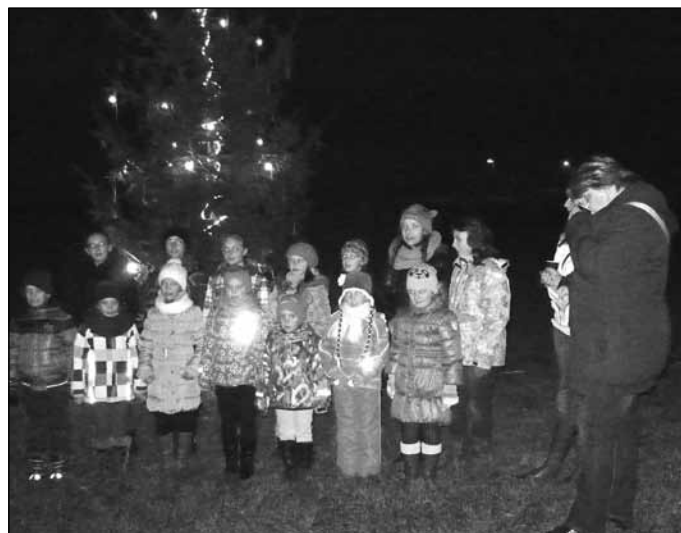
odpočinout nebo zašli s rodinou na jídlo či kávu do naší restaurace. Přejeme Vám především hodně zdraví, štěstí, spokojenosti a těšíme se na další shledání s Vámi v nadcházejícím roce 2015.