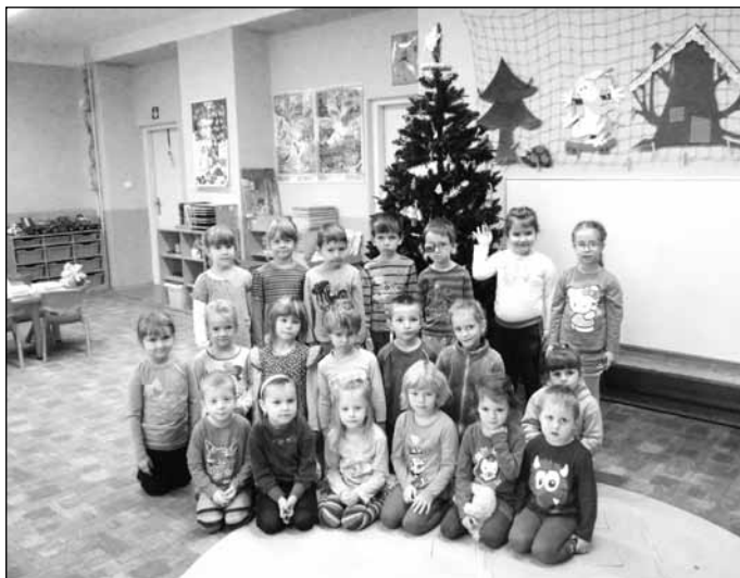
Z oblohy sypou se hvězdičky, slyšet jsou koledy z dále. Zvěstuje andílek maličký, ať splní se vše, co jste si přáli.